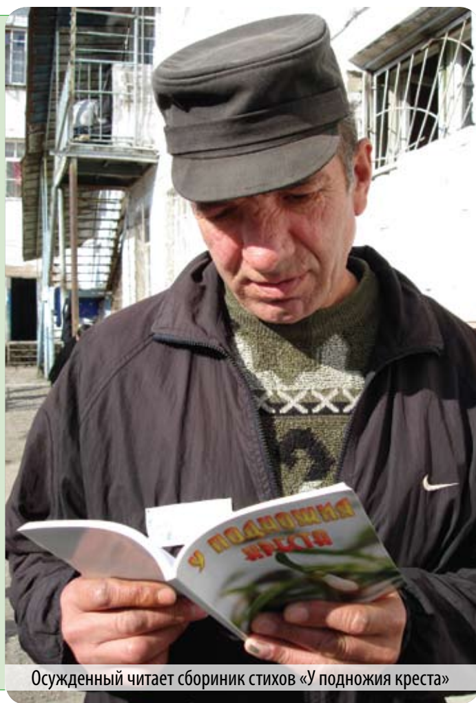
Осужденный читает сборник стихов «У подножия креста»

Наше желание, чтобы увеличился тираж и объем журнала, расширилась география его распространения, так как мы желаем еще большему числу заключенных рассказать об Иисусе Христе. Также мы хотим продолжать выпускать сборники стихов и свидетельств заключенных.